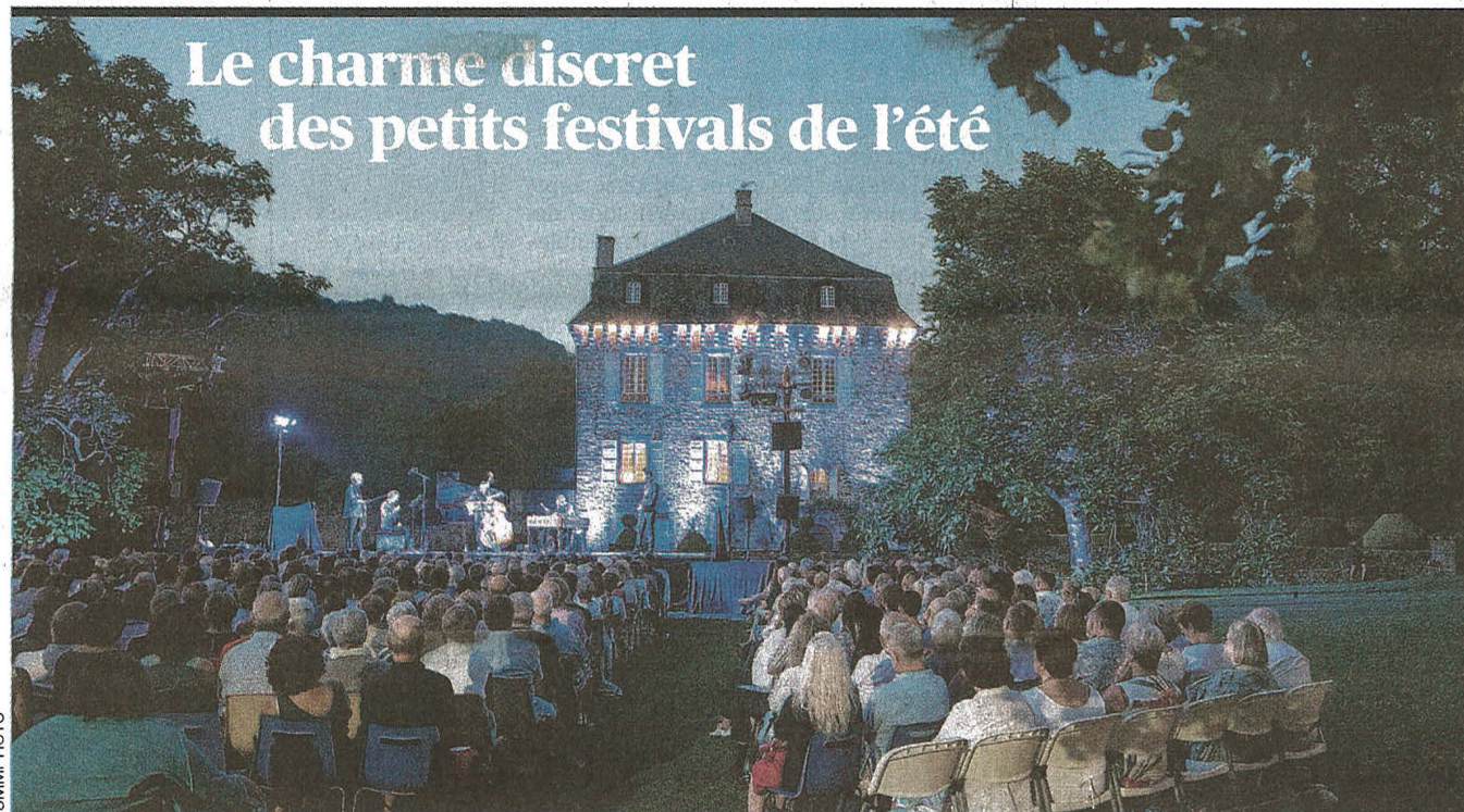
Le charme discret des petits festivals de l'été

→ 46% DE PARTICIPATION ESTIMÉE, UN NIVEAU HISTORIQUEMENT BAS → À STAINS, DE NOMBREUX ÉLECTEURS NE SAVENT MÊME PAS QU'UNE ÉLECTION A LIEU DIMANCHE → LE RN ET LE « TRAUMATISME » DES ÉLECTIONS RÉGIONALES PAGES 2 À 4, 19 ET L'ÉDITORIAL